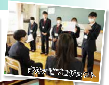
吉井ナビプロジェクト