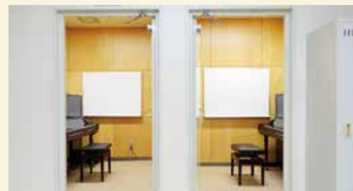
ピアノレッスン室