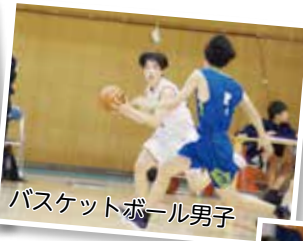
バスケットボール男子