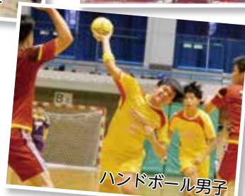
ハンドボール男子