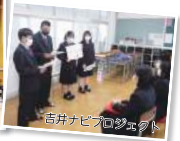
吉井ナビプロジェクト