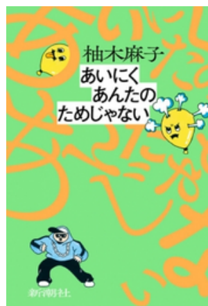
柚木麻子 著 『あいにくあんたのため じゃない』新潮社刊

この作品はすでに本格ミステリ大賞、日本推理作家協会賞、山本周五郎賞を受賞しています。グリコ、坊主めくり、だるまさんがころんだ等の誰もが知る遊びに独自のルールを加えて高校生が真剣勝負。ゲームをしているだけなのに、その頭脳戦、心理戦に圧倒されます。